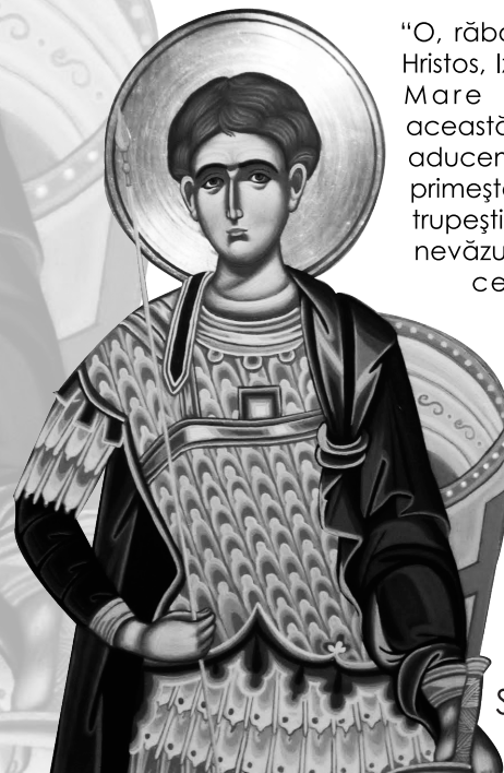
Sf. M.Mc. Dimitrie

"O, răbdătorule de chinuri al lui Hristos, Izvorătorule de mir, Sfinte Mare Mucenice Dimitrie, această a noastră rugăciune, ce aducem ție acum cu umilință, primește-o, și de bolile sufletești și trupești și de vrăjmașii cei văzuți și nevăzuți, cu rugăciunile tale cele bineprimite către Dumnezeu, ne pazește, ca împreună cu tine în veacul ce va să fie, să cântăm Lui : Alluia !" (Condacul 13 din Acatistul Sf. M. Mc. Dimitrie).