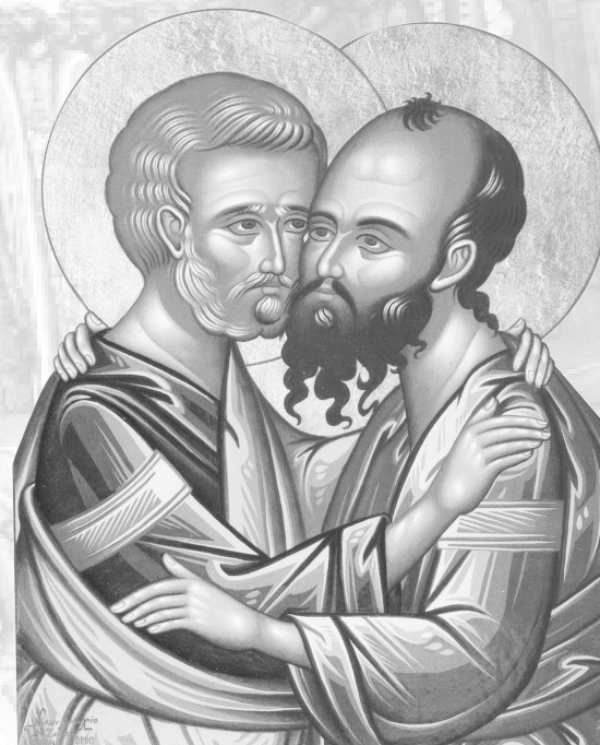
Sf. Apostoli Petru și Pavel