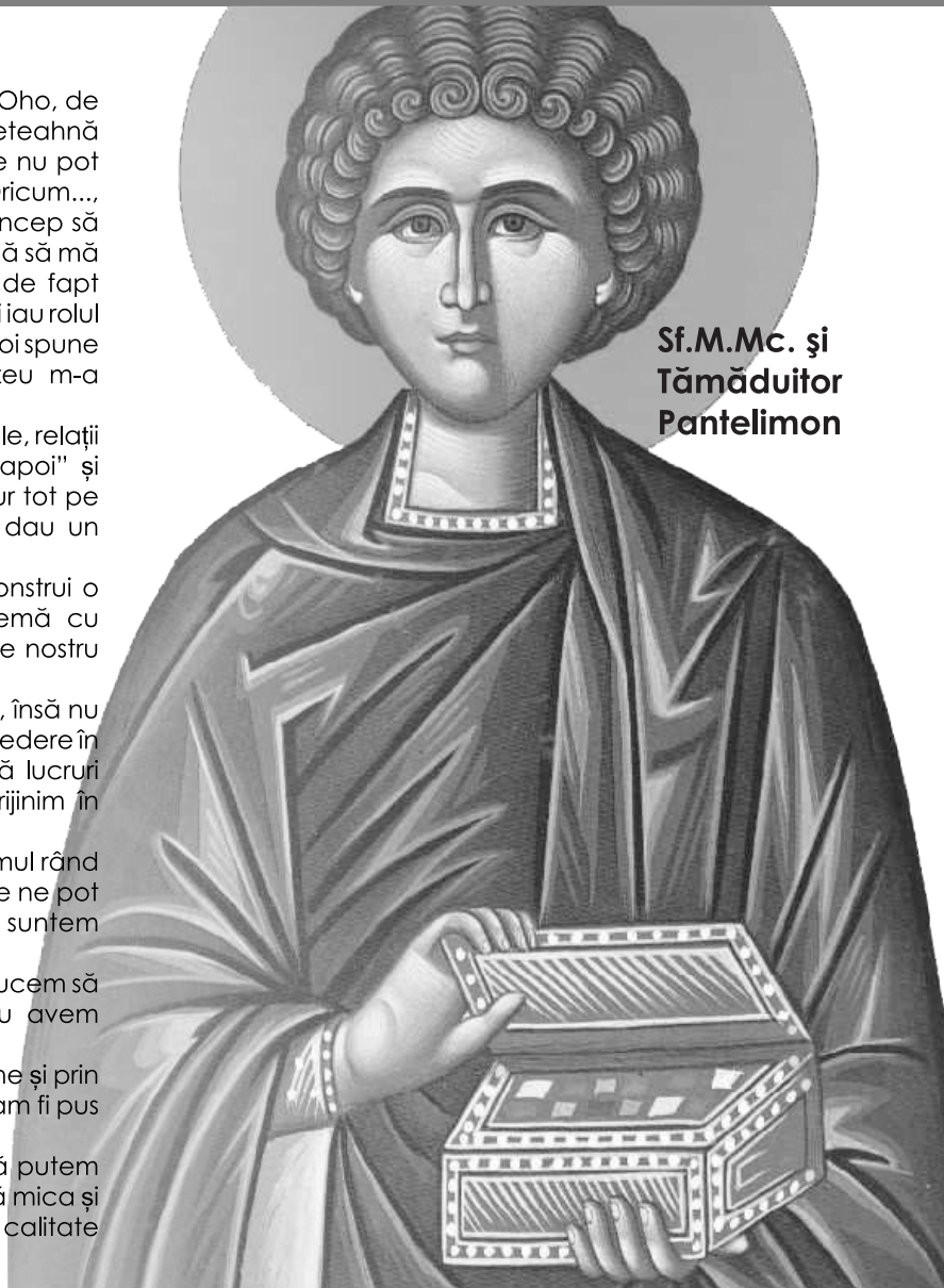
Sf.M.Mc. și Tămăduitor Pantelimon

Răspunsul este că încrederea reciprocă ne-a dovedit că putem face toate acestea și încă și mai multe, iar exemplul ne stă miza și tânăra noastră comunitate care prin mai sus menționata calitate face lucruri despre care ceilalți spun că sunt doar idealuri.