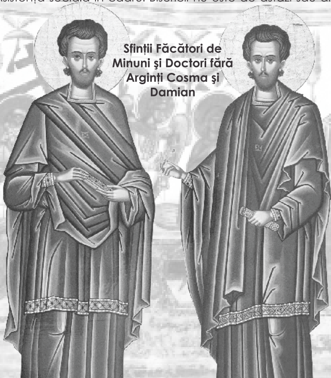
Sfinții Făcători de Minuni și Doctori fără Arginți Cosma și Damian

Practicarea filantropiei și milei contribuie atât la progresul spiritual și moral al fiecărui om, adică la umanizarea lui, dar și la evitarea unor tensiuni sau conflicte sociale. Mila adevărată, adică iubirea unui om pentru alt om este podoaba cea mai de preț a personalității. A iubi și sluiji aproapele ca pe tine însuși înseamnă a revărsa, a întoarce iubirea din tine însuși/ însăși asupra celor care au nevoie de ajutorul tău; noi știm acest lucru, dar nu-l practicăm întotdeauna. În activitățile sociale în care m-am implicat de nenumărate ori, alături de tinerii din parohie am încercat să aduc pentru o clipă zâmbetul pe buzele celor întristați și bucurie în sufletele celor necăjiți. Cercetând pe cei neajutorați, pe bătrânii care sunt neputincioși, pe copiii orfani și pe cei care, datorită anumitor fapte contrare legilor morale și a celor civile, au ajuns în spatele gratiilor, vrem să arătăm că iubirea cea adevărată trebuie mărturisită prin fapte și că a fi creștin înseamnă a-ți iubi aproapele ca pe tine însuși, așa cum poruncește Însuși Mântuitorul Iisus Hristos (Mt. 22, 39). Toate aceste fapte ale finerilor care iubesc Biserica și învățătura ei nu fac decât să aducă o rază de lumină în sufletele oamenilor și încrederea că numai iubindu-ne reciproc și fiindu-ne de ajutor unul altuia putem fi mai puternici în lupta contra celui rău.