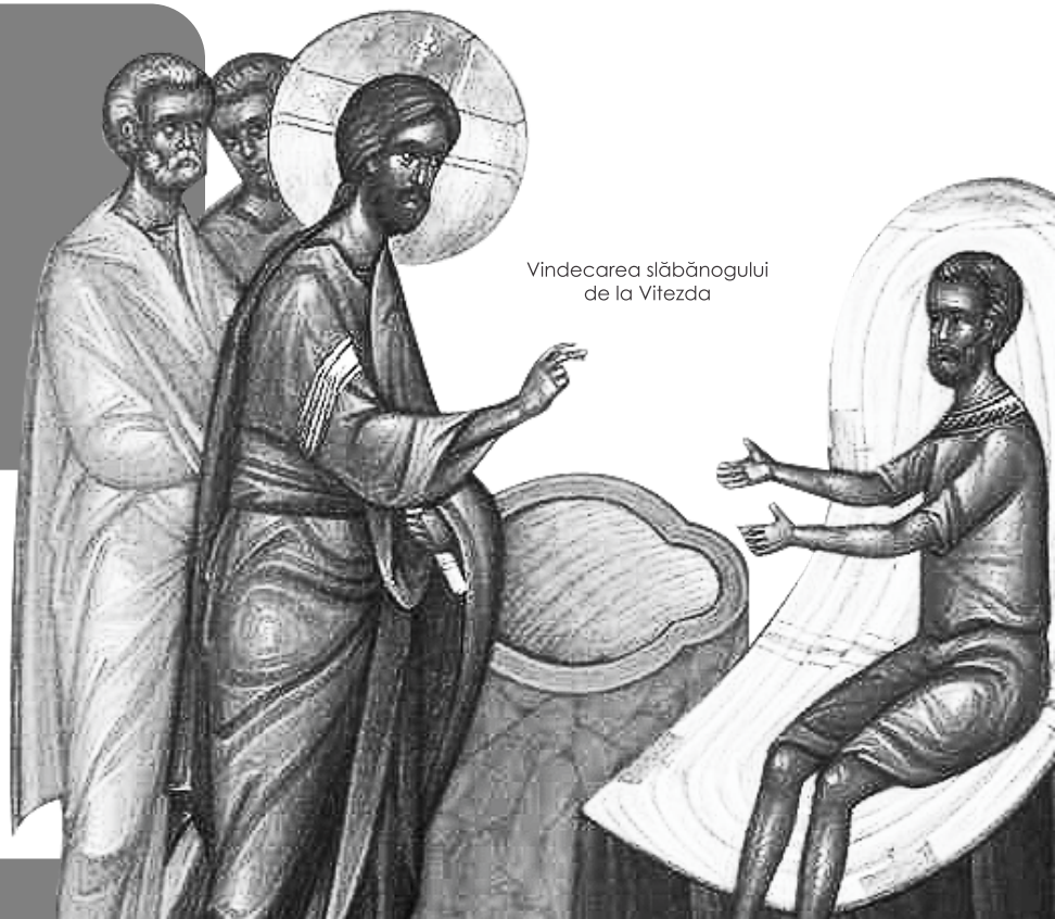
Vindecarea slăbănogului de la Vitezda

„Iată că te-ai făcut sănătos. De acum să nu mai păcătuiești, ca să nu-ți fie ceva mai rău”. (Ioan 5, 14)