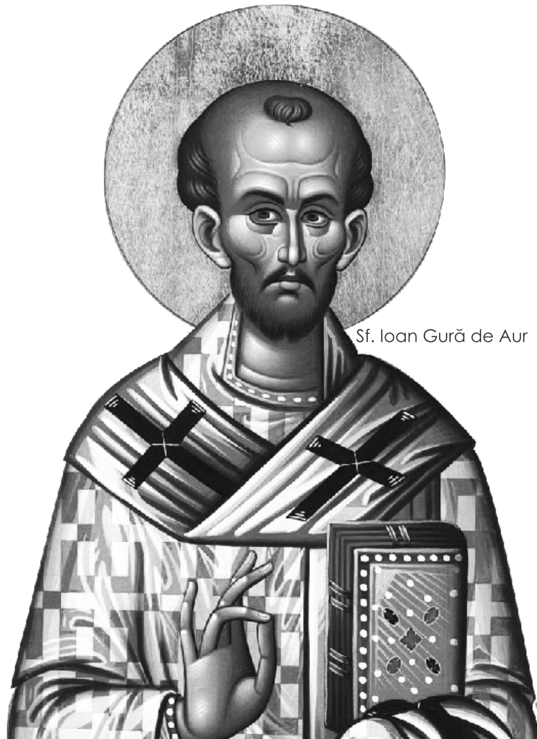
Sf. Ioan Gură de Aur

RO 02 RZBR 0000 0600 1219 1317 - LEI RO 18 RZBR 0000 0600 1435 9658 - EURO RO 93 RZBR 0000 0600 1435 9666 - USD Raiffeisen Bank, Agenția Decebal.